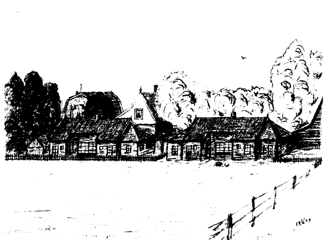
Gezicht op het Hanepad, Zaandam (1929)

B: 'Ik ben er trots op, maar ik heb altijd gezegd dat ze er