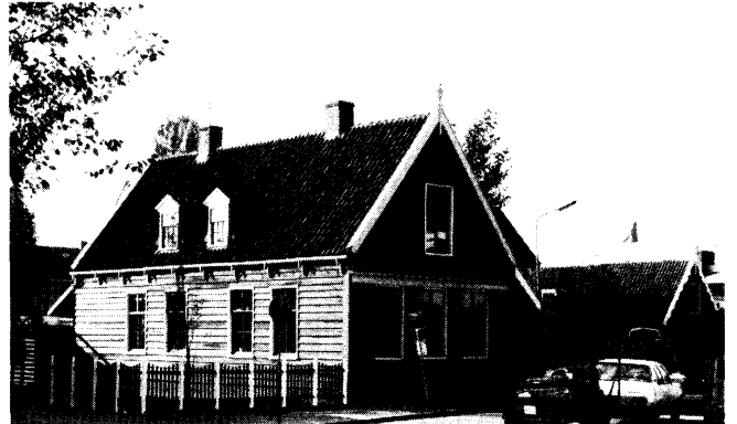
Na de renovatie van dit deel van de Kerkbuurt.