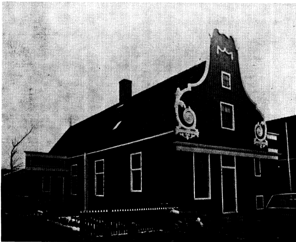
Het huis uit Assendelft waar het Zaanse Uurwerken Museum in gevestigd is