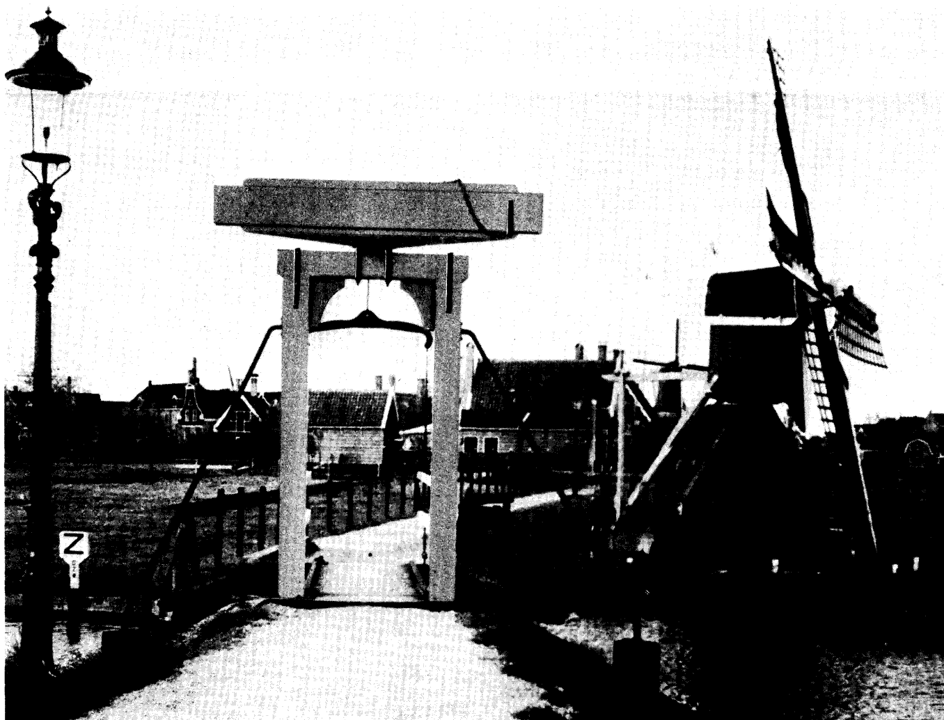
De ophaalbrug in het verlengde van het Zeilenmakerspad

Het bestuur prijst zich dan ook gelukkig dat het in 1973 toch tal van zaken heeft kunnen aanpakken en realiseren. Uiteraard bleef dat alles in de schaduw van de festiviteiten van 8 juni 1972, toen Hare Majesteit de Koningin drie