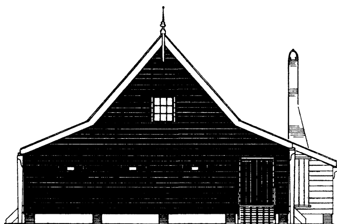
Westgevel van het pakhuis „De Lelie”

Uit bijgaande financiële stukken blijkt dat de financiële positie van de Zaanse Schans nog steeds gezond is. Er