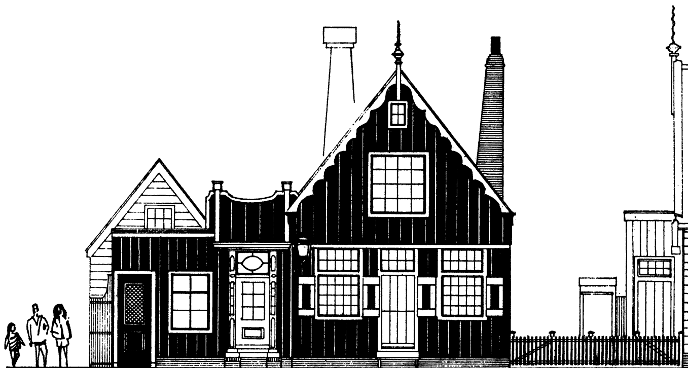
Het Bakkerij Museum

Als de Zaanse Schans eenmaal volledig zijn vorm heeft gekregen, zal er 10 miljoen gulden in zijn geïnvesteerd. Hiervan is door de bevolking van de streek dan 1½ miljoen