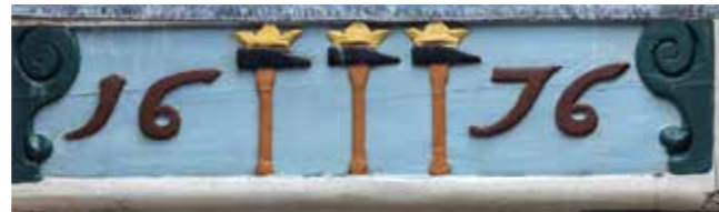
Deurekalf smederij De Drie Gekroonde Hamers, Hogendijk 46, Zaandam.