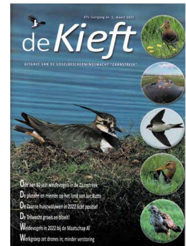
Jubileumnummer van de Kieft.