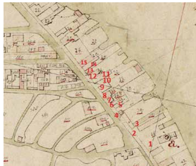
Het kadastraal minuutplan uit 1817, voorzien van nummers die corresponderen met de panden op de Westzijderol.

Alle panden op het meest linker stukje Westzijderol zijn genummerd om het exacte beginpunt te bepalen. Twee intrigerende houtloodsen op nummer 9 en 12. GAZ 10_00001