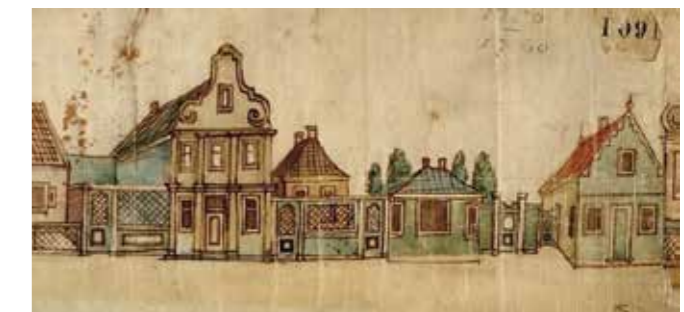
Het meest rechter stukje Westzijderol ter hoogte van Westzijde 16-22 met het catalogusnummer van de tentoonstelling uit 1874. Orgelhandelaar Schipper woonde ongeveer tegenover de plek van het linker huis. GAZ 10_00001