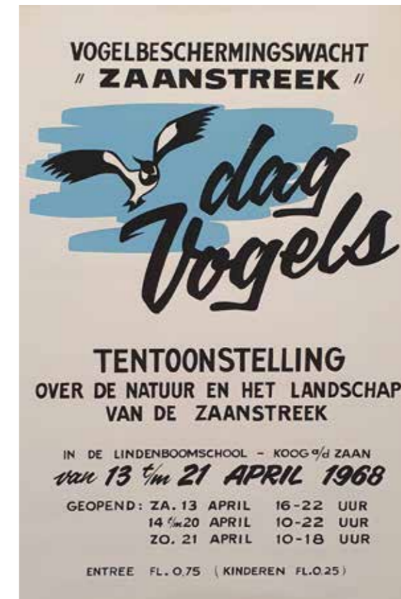
Affiche van de tentoonstelling Dag Vogels .