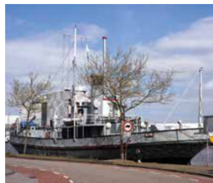
De Elfin aan de kade van het Zuideinde in Wormerveer.