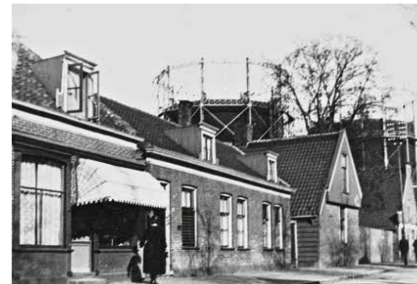
Het huis met de dakkapel is Westzijde 314. Het werd in 1876 gebouwd op de plek van de linker houtschuur en het huis daarnaast (nummer 12 en 13). GAZ 22_04574

Terug naar Jacob Groot, die al heel lang eigenaar was van de panden ten zuiden van die van Hero Graftdijk (hoogstwaarschijnlijk vanaf nummer 7-11). Al in 1732, een jaar na zijn huwelijk, stonden deze percelen op zijn naam. Wellicht heeft hij ze uit een boedel geërfd; onderzoek in notariële archieven kan daar licht op werpen. Jacob Jacobszn. Groot was net als Hero Graftdijk een vermogend houthandelaar, die sinds 1732 eigenaar was van houtzaagmolen De Heerlijkheid Cralingen. Deze stond aan de oostkant van de Watering in Westzaandam, ten noorden van de Papenpadslot. De molen werd rond 1756 afgebroken, het jaar waarin Groot molen De Bonsem aan de oostkant van de Watering in Westzaandam kocht. Met De Bonsem bleef Groot meer dan dertig jaar hout zagen; de al