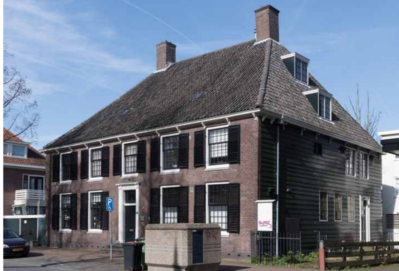
Het doopsgezinde wees- en armenhuis, Stationsstraat, Zaandam.