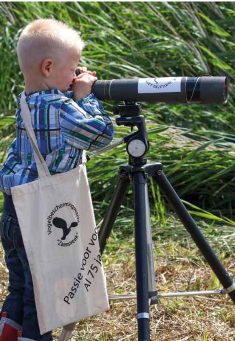
Al klein het vogelspotten geleerd tijdens Wandelen over Water , de jaarlijkse vaar- en wandelexcursie door het Guisveld georganiseerd door Staatsbosbeheer en de Vogelwacht.

de uitbreiding van industrie en woningbouw, was woedend op de protesterende vogelaars en geenszins van plan de handdoek in de ring te gooien. Integendeel. Een kleine, selectieve greep uit de (regionale) krantenkoppen over het 'Dossier Guisveld' moge daarvan getuigen: 'College van Zaanstad houdt vast aan bebouwen Guisveld' (27 april 1976); 'Meerderheid van Staten nu voor bebouwing Guisveld' (10 december 1976); 'Spoedig plan voor 1200 woningen in Guisveld' (14 december 1976); 'KvK: woningbouw in Guisveld' (15 oktober 1980).