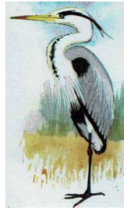
Blauwe reiger in prachtkleed.

De strenge winter van 1963 had enorme gevolgen voor de reigerpopulatie; die werd gedecimeerd. Alle alarmbellen rinkelden bij drie Zaanse vogelwachters toen ze kort daarop hoorden dat de boomgaard bij boerderij De Eenhoorn in de Beemster zou worden gekapt (voor landverkoop). Daar broedde een reigerkolonie. Het moest de boer f 12.000 opleveren. ‘Als wij jou nou eens 13.000 gulden geven’, stelde het vermetele drietal de boer in een drieste bui voor, ‘in ruil voor het laten staan van de bomen?’ De boer ging akkoord, maar ach, waar haal je zo gauw f 13.000 vandaan? Het probleem werd voorgelegd aan Jan Strijbos, bekend ornitholoog en natuurfotograaf en -filmer, met nauwe banden met de Zaanse vogelwacht. Strijbos schreef frequent vogelstukjes, eerst voor De Telegraaf , later voor Het Parool . Zijn beroemdste boek was De Blauwe Reiger , de eerste Nederlandse monografie (1935) over de blauwe reiger. Een paar dagen later verscheen een groot artikel in Het Parool met als strekking: adopteer een reiger voor 25 gulden! Het geld stroomde binnen; in drie maanden tijd werd f 30.000 gedoneerd, ruim voldoende voor het uitkopen van de boer. Het resterende bedrag is naar een stichting gegaan, die ‘alles over de reiger’ zou boekstaven.