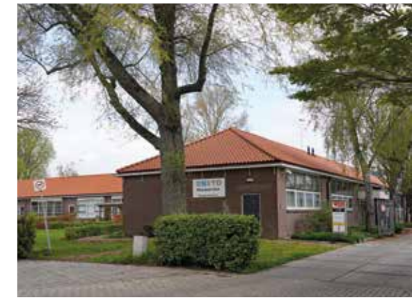
De Dr. A. van Voorthuissenschool aan de Slachthuisstraat in Zaandam.