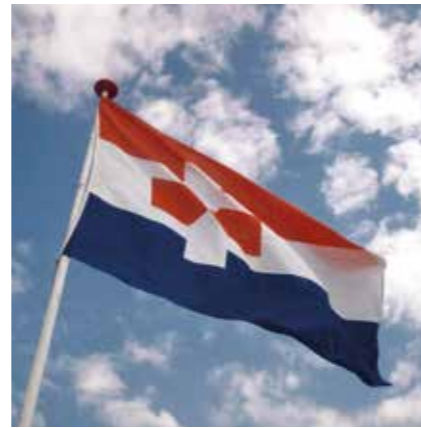
De vlag van Zaanstad.

Volgend jaar is het vijftig jaar geleden dat zeven voormalige Zaanse dorpskernen werden samengevoegd tot de administratieve en ambtelijke gemeente Zaanstad. Al zal niemand zich Zaanstadter noemen, maar Zaankanter en liefst nog Zaandijker, of misschien wel Galgezager voor Zaandammer of Gladoor voor Wormerveerder. Die twee laatste namen zijn trouwens voorbeelden van immaterieel erfgoed. Ook de postadressen behielden hun voormalige dorpsnamen. De gemeente Zaanstad nodigt haar inwoners en organisaties uit om mee te denken over de viering van het jubileumjaar. Er is € 600.000,- voor uitgetrokken. Het is nog een half jaar, de tijd is krap. Het Erfgoedplatformoverleg overweegt een tijdelijke werkgroep in het leven te roepen om de diverse