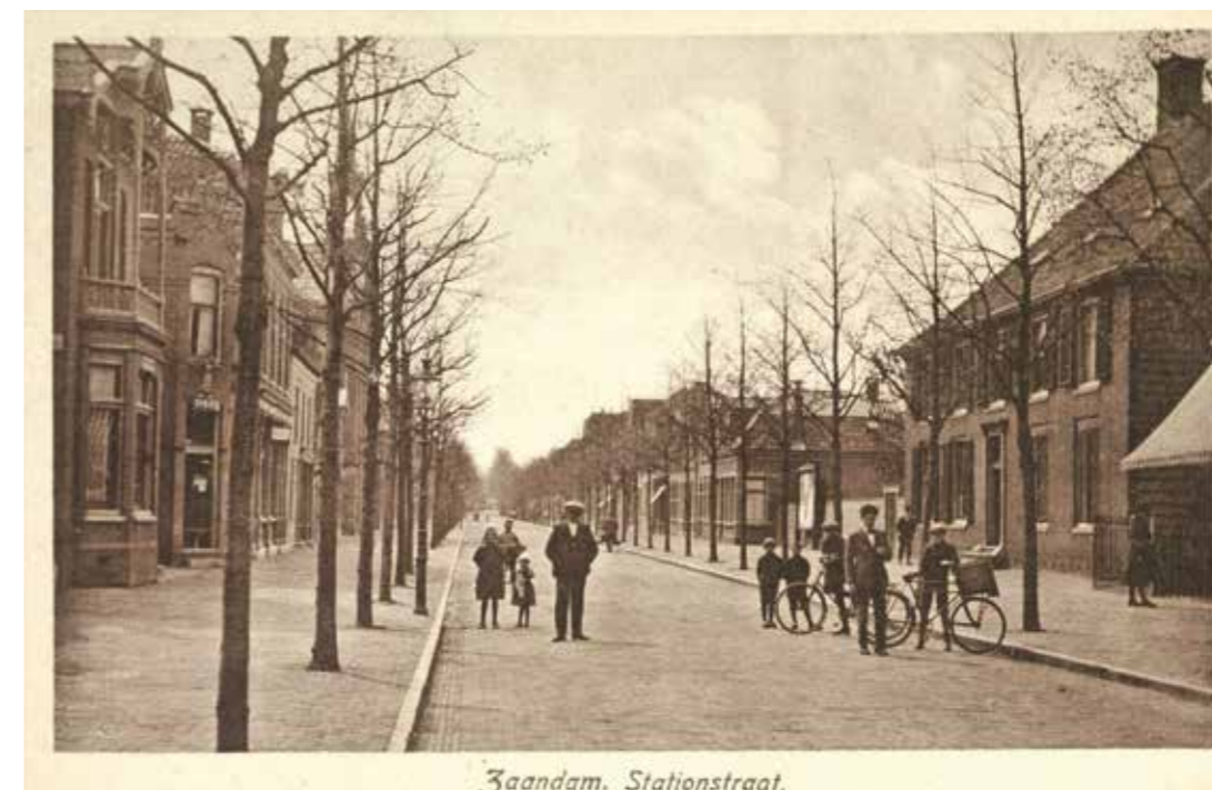
De Stationsstraat in Zaandam begin 1900 met rechts op nr. 6 het Doopsgezinde Weeshuis.