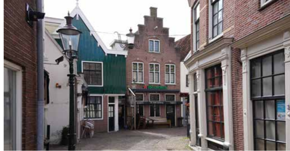
De karakteristieke Klauwershoek met De Oude Herberg.

goed gesprek aan de bar. 'Ze kopen geen biertje bij het café, maar bij de mens achter de bar. Ik heb een luisterend oor, maar kan ook een lied zingen of een goede grap vertellen. Jammer dat zoveel bruine cafés verdwijnen. Je zit hier toch veel gezelliger dan bijvoorbeeld in een loungebar? Ik run de boel hier nu bijna een jaar, maar deze kroeg bestaat al veel langer.' Zes dagen in de week worden er sterke verhalen verteld aan de bar, wordt er sport gekeken op het grote scherm of verspeelt iemand zijn salaris op een van de twee gokkasten. Alleen op dinsdag blijft de deur dicht. De Oude Herberg is momenteel alleen overdag open, maar Polak zoekt personeel voor twee avonden in de week. 'We moeten het met name hebben van het dagvolk en die komen niet 's avonds. Op maandagmiddag zitten we bijvoorbeeld met een gezellig groepje aan de bar te dobbelen. Het zijn niet alleen oude mannen die hier komen. Deze week viert een vrouw haar 24ste verjaardag met een groep vriendinnen. Zij zijn gelukkig ook nog dol op de bruine kroeg.' 25 FEBRUARI