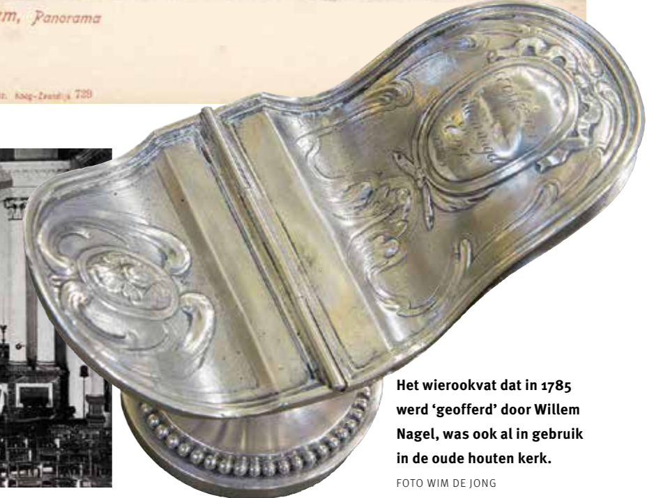
Het wieroekvat dat in 1785 werd 'geofferd' door Willem Nagel, was ook al in gebruik in de oude houten kerk.