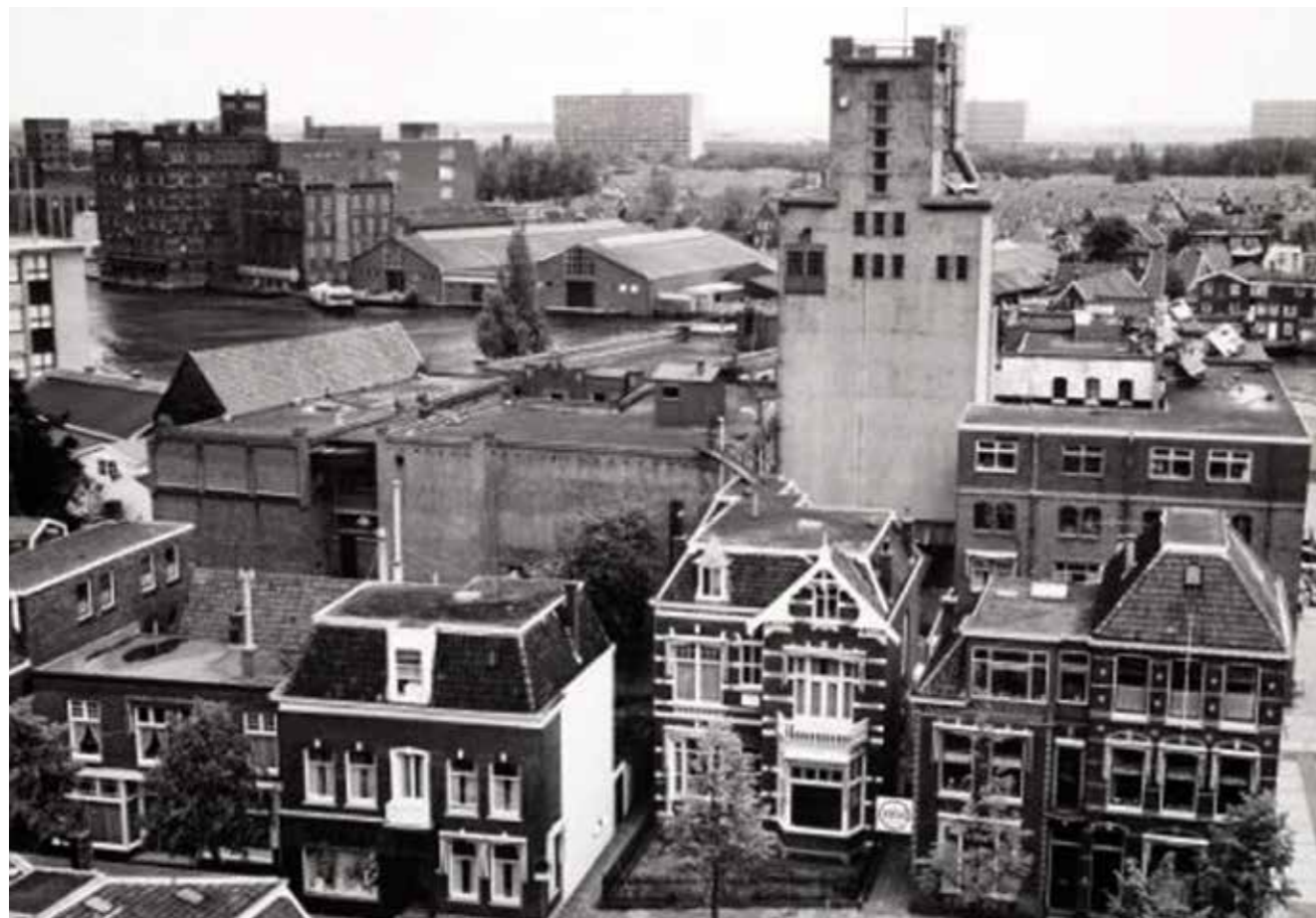
◀ De villa van Simon de Wit met op de achtergrond een bedrijfssilo.