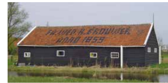
Pannendak van de werf 'Wed. K. Brouwer', Kraaienpad 2, Zaanse Schans, Zaandam.

Tegenwoordig hebben op de Zaanse Schans werkzame vrouwen minder mogelijkheden dan Zaanse weduwen in de zeventiende en achttiende eeuw. Ze zijn voornamelijk zichtbaar in de bediening van het publiek in molens, musea, winkels en horeca of als vrijwilligster.