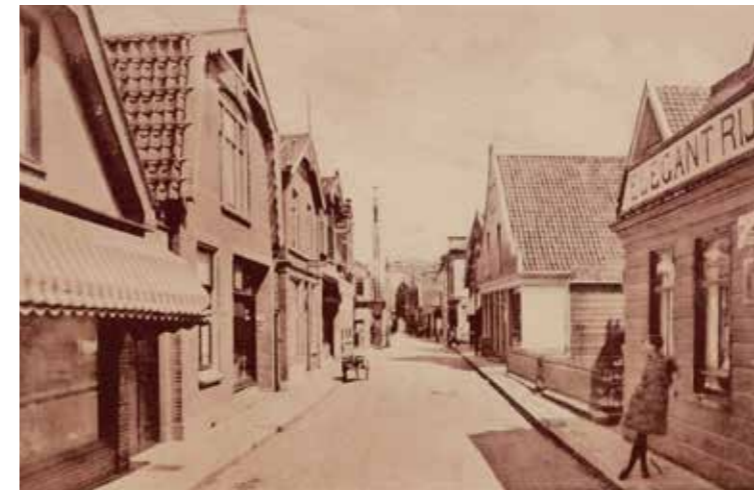
Vlietsend Krommenie omstreeks 1930. Het tweede huis van links is nummer 59.