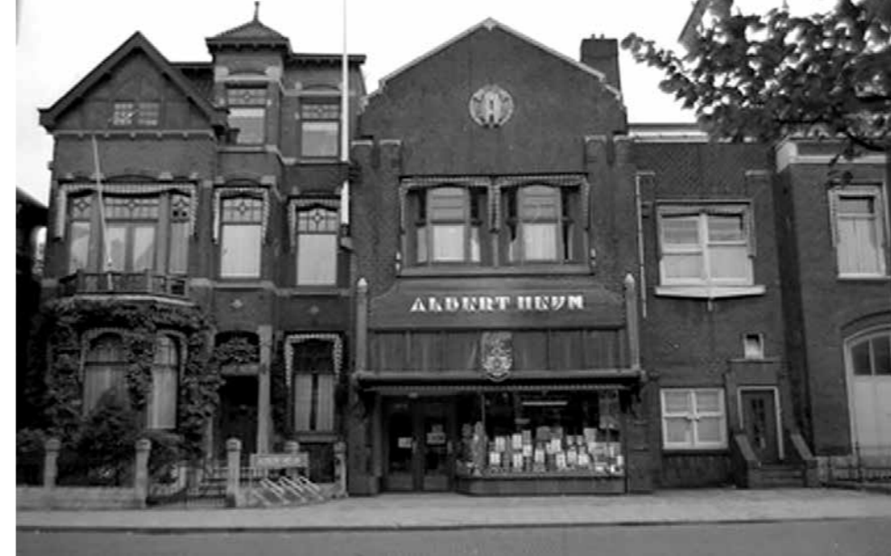
De villa van Albert Heijn op Westzijde 30 in Zaandam zien we links op de foto. De winkel op nr. 28 er rechts naast.

Aan de Westzijde nummer 30 in Zaandam kocht de stichter van het Albert Heijn-bedrijf, Albert Heijn, in 1899 uit een veiling een woning. Met vrouw en kinderen verhuisde hij op de laatste dag van de eeuw met een arrenslee vanuit