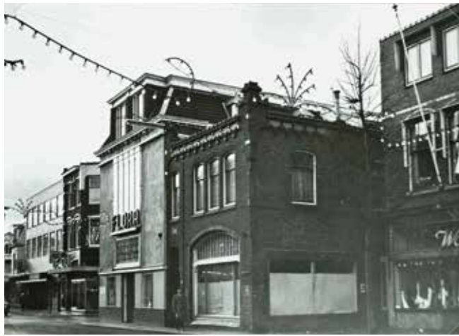
Rechts het pand waar orgelhandelaar Schipper begin twintigste eeuw woonde. Het is in 1978 met de naastgelegen bioscoop vervangen door het huidige flatcomplex. GAZ 22_12699

› Westzijde 6 is niet getekend op de Westzijderol. Het is het woon-/winkelhuis van Willem Schipper, de broer van de orgelhandelaar. GAZ 22_04409