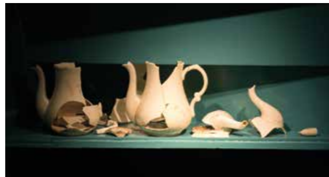
De voorheen gesloten provisiekelder is nu een open vitrinekast, gevuld met lokale archeologische bodemvondsten van achttiende- en negentiende-eeuws aardewerk.