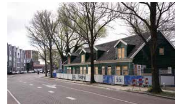
De vier arbeiderswoningkjes aan de Westzijde te Zaandam, die worden gerestaureerd door Stadsherstel.

Al anderhalf jaar wordt gewerkt aan de restauratie van de vier arbeiderswoningen aan de Westzijde in Zaandam. Deze zomer verwacht Stadsherstel klaar te zijn en kunnen ze worden verhuurd. Het blok van vier woningen stond er jarenlang verwaarloosd bij. Scheefgezakt, verrot en later gekraakt. Een ontwikkelaar zou het meteen plat