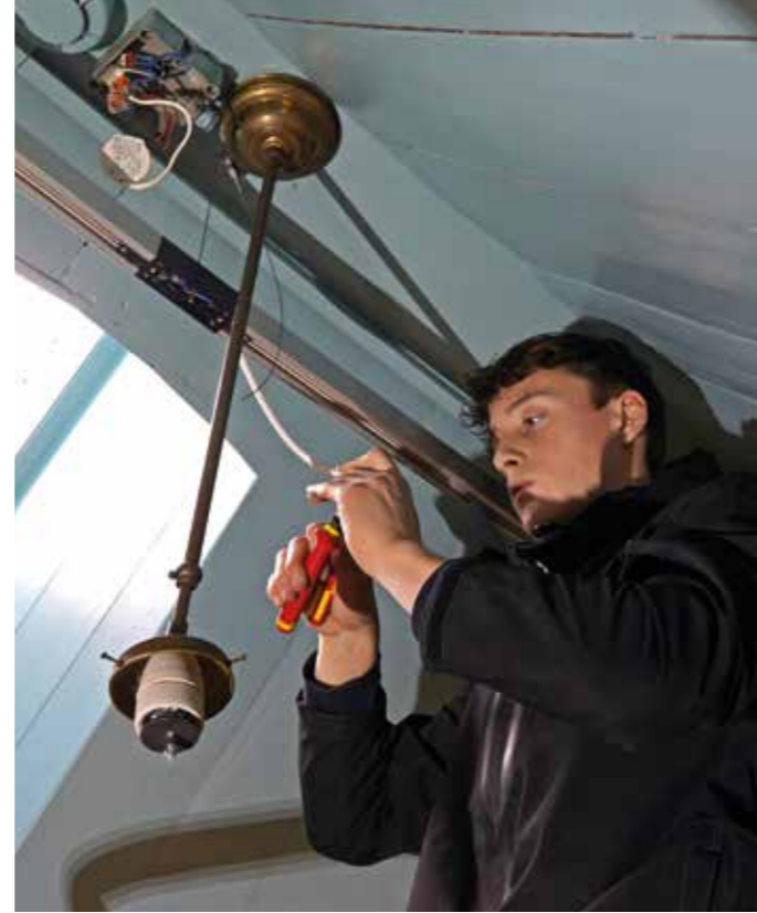
Overal in het huis werd de verlichting vervangen, zoals hier op de zolderetage.