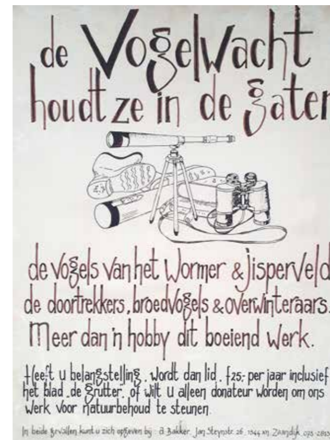
Ledenwerving voor de Vogelwacht Zaanstreek.

Om de band met de leden te verstevigen werden van september tot en met april maandelijkse ‘contactavonden’ in het leven geroepen, waarop leden zelf, aan de hand van lichtbeelden (toen) en digitale foto's/video's (nu), over hun vogelreizen of actuele vogelonderwerpen – zoals het zenderen van vogels, de vossenproblematiek of het beheer van de veenweidegebieden – een voordracht houden. Ook werd een start gemaakt met excursies. In de jaren vijftig betekende dat: op de fiets naar de pieren van IJmuiden of (óók fietsend!) naar Texel, waarbij gekampeerd werd in legerentjes van de Hela Hola, legerdump in Koog aan de Zaan. Ja, dat waren nog eens échte vogelhoogtepunten; naar 't Wad, met zijn tienduizenden steltlopers en strandlopers en de enorme vluchten van ontelbare vogels bij hoogwater. Telescopen, om de vogels in detail te bestuderen, had je toen nog niet en slechts weinigen konden zich een mooie vogelkijker veroorloven, zodat de excursieleiders hun verrekijkers onder de deelnemers lieten rouleren.