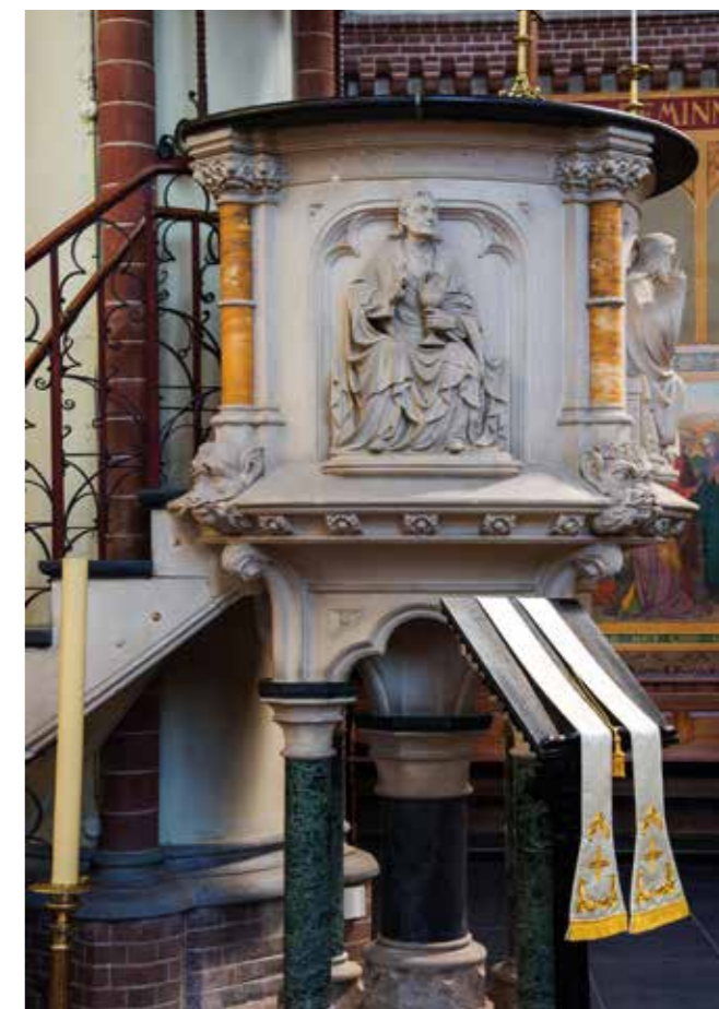
Het interieur van de nieuwe Sint Bonifatiuskerk met de gebrandschilderde ramen is van een uitzonderlijke schoonheid.