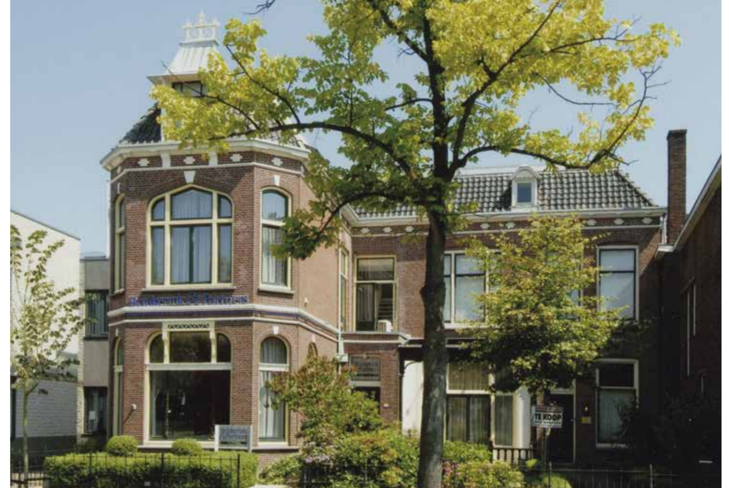
De villa van A.W. Sabel, aan de Westzijde in Zaandam, sinds 1975 in gebruik bij een marketing- en communicatiebureau. Links de muziekschool. FOTO GAZ 21_52149

In het volgende nummer zetten we onze speurtocht voort via de Provincialeweg in Zaandam tot in Krommenie. We vermelden dan ook de bronnen. ●